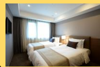
客室の一例/イメージ

【チェックイン】15:00 【チェックアウト】11:00 【客室】部屋指定なし(トリプル不可) 【Wifi】無料 【アクセス】地下鉄1号線・2号線西浦駅下車7番出口より徒歩約3分