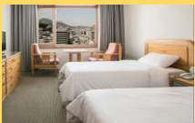
客室の一例/イメージ

【チェックイン】14:00 【チェックアウト】11:00 【客室】部屋指定なし 【Wifi】無料 【アクセス】地下鉄1号線南浦駅下車7番出口より徒歩約3分