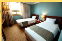
客室の一例/イメージ

【チェックイン】14:00 【チェックアウト】12:00 【客室】部屋指定なし(トリプル不可) 【Wifi】無料 【アクセス】地下鉄1号線釜山鎮駅下車7番出口より徒歩約3分