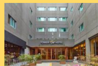
ホテル外観/イメージ

【チェックイン】15:00 【チェックアウト】11:00 【客室】部屋指定なし 【Wifi】無料 【アクセス】地下鉄1号線中央駅下車徒歩約5分