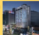
ホテル外観/イメージ

【チェックイン】15:00 【チェックアウト】11:00 【客室】部屋指定なし 【Wifi】無料 【アクセス】地下鉄1号線チャガルチ駅下車7番出口より徒歩約3分