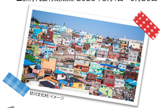
甘川文化村/イメージ