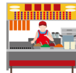
台湾の屋台 イラストイメージ