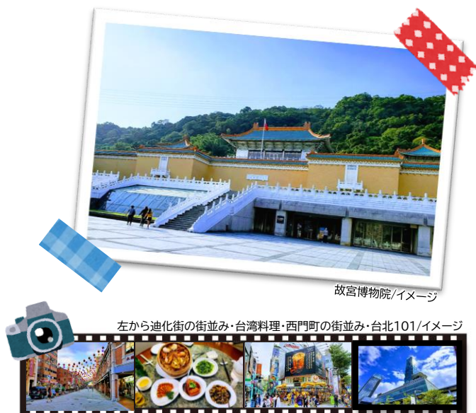
故宮博物院/イメージ