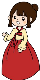
チマチョゴリのイラストイメージ