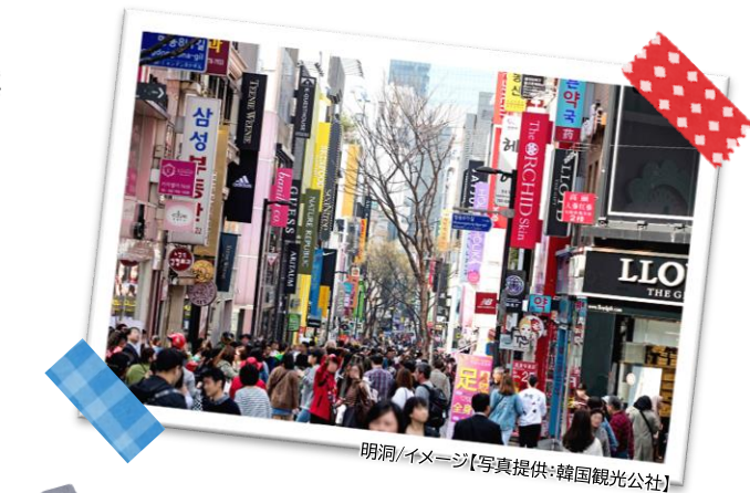
明洞/イメージ

国内空港施設利用料、旅客保安サービス料、国際観光旅客税、 現地空港諸税が別途必要となります。