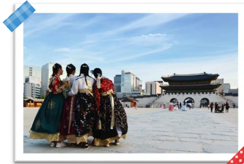
ソウル市内・景福宮/イメージ

※復路LJ345便利用のお客様はお一人様あたり 5,000円 の追加代金がかかります。ホテルが早朝(概ね3:30~4:30頃)出発となります。※専用タクシー又は混載ワゴン利用(事前指定不可)となります。※2名様以上での申込みとなります。※満車などにより手配できない場合もあります