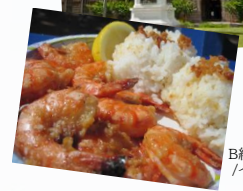
B級グルメ/イメージ

オアフ島の人気観光スポットとB級グルメスポットを1日で回りたい！ という願いを叶えた満足度120%のおすすめツアーです！ 昼食は大人気のガーリックシュリンプをご堪能ください ※送迎あり