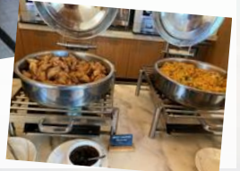
ラウンジでの夕食/イメージ