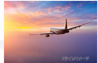
フライトイメージ