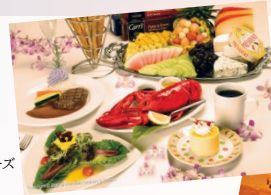
サンセットディナークルーズ イメージ