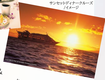
サンセットディナークルーズ イメージ