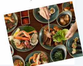
ビュッフェでの夕食/イメージ

ハイアット・リージェンシー・ワイキキ・ビーチリゾート ダイヤモンドヘッドタワー3階 ワイキキビーチを一望するオープンエアのレストランで、新鮮なシーフードをはじめ、 韓国風バーベキューステーションや韓国のおかず“バンチャン”など、 極上のビュッフェ料理をお楽しみいただけます。