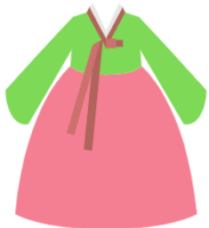
チマチョゴリのイラストイメージ