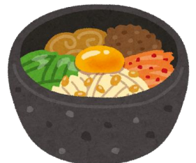
石鍋ビビンバのイラストイメージ